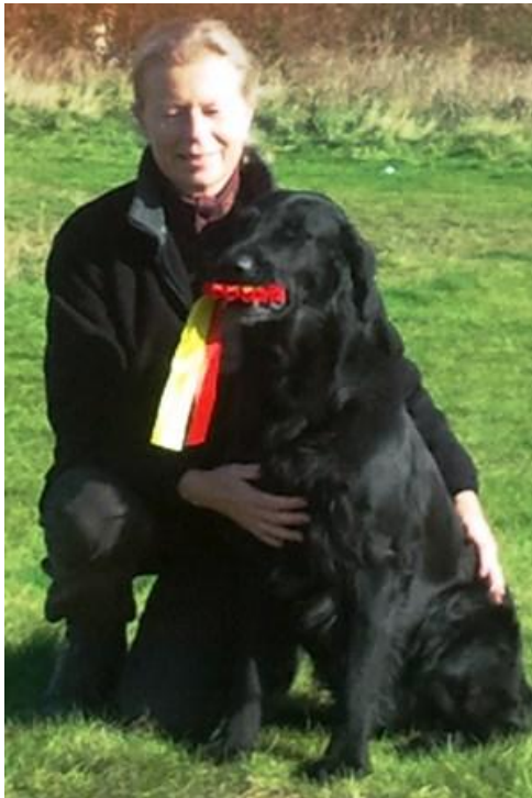
Bell blev lydnadschampion 2011-11-19