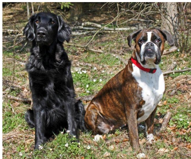
Nisse och Roxie – 2:a och 3:a, SÖSK BK appelltävling

Skicka ditt resultat till hemsidan@lommabk.com , senast 14 dagar efter tävlingen eller lägg en lapp i TS låda.