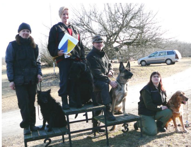
Prispallen Sök Elit

Stort tack från TS till alla Er som ställde upp i skogen, på planen, i köket och på kontoret.